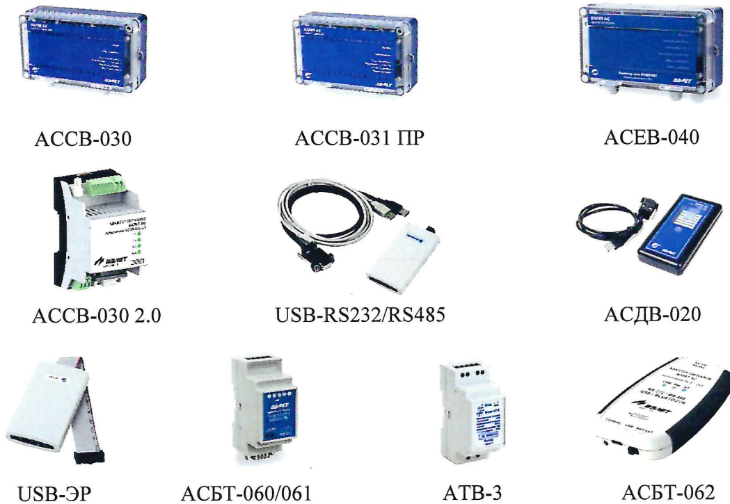
Рисунок 1 – Общий вид преобразователей

Общий вид преобразователей представлен на рисунке 1.